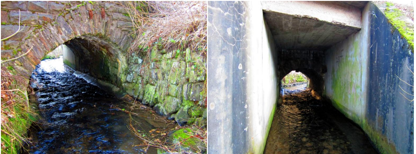
Linkes Foto: Der gemauerte Bogen hat eine Höhe von 1,6 m und eine Breite in Wasserhöhe von 2,5 m. Die Länge (sprich die Fahrbahnbreite bis 1966) liegt bei 6 m. Rechtes Foto: Der Bogen in der heutigen Brückenmitte hat eine Höhe von 1,9 m und der 1966 errichtete Betonteil eine Länge von 5 m. Somit hat das gesamte Brückenbauwerk eine Länge von 11 m. Die Fotos wurden am 31. Januar 2014 aufgenommen.