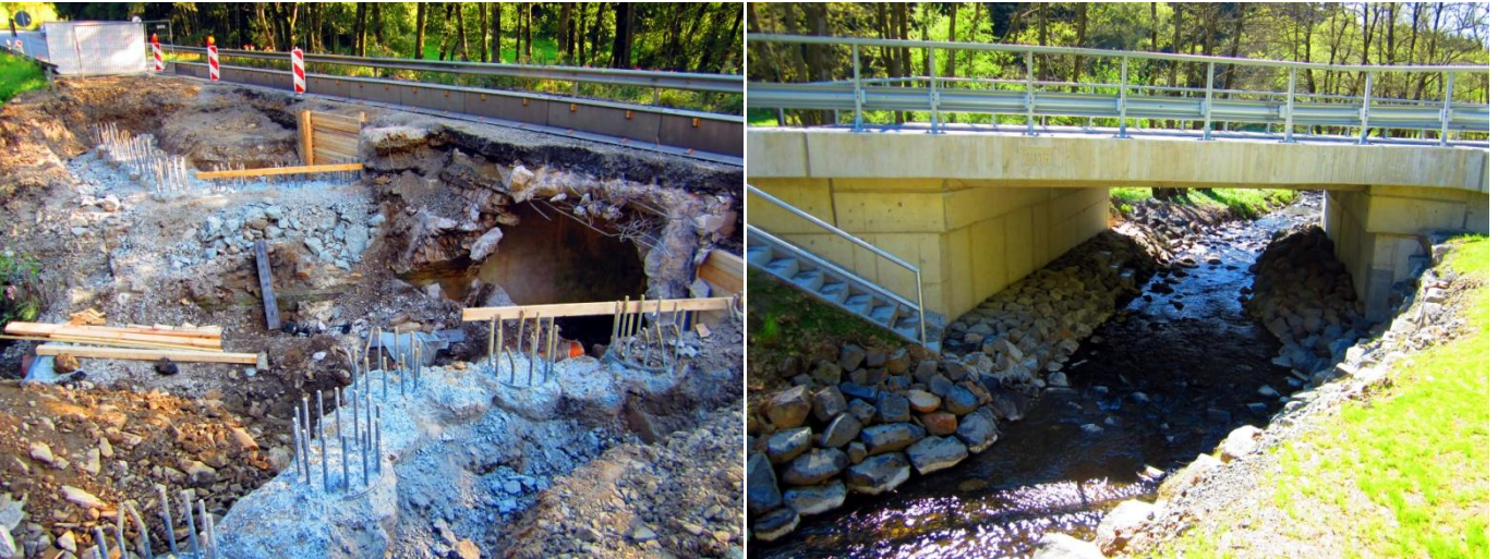
Das linke Foto zeigt Reste des gemauerten Bogens aus dem Jahre 1867. Das rechte Foto wurde am 7. Mai 2015 aufgenommen. Die "Weiße Brücke" hat nun eine Spannweite von 6,30 m und eine Höhe von 2,70 m. Im Fahrbahnbereich beträgt die Breite 9,20 m und unterhalb der Fahrbahn, aufgrund des Winkels, 10,20 m

Text: Marc Rosenkranz, Emmerzhausen