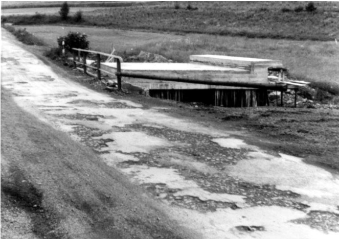
Errichtung der "Weißen Brücke" im Jahre 1966. Die Breite beträgt 5 m. Der gemauerte Bogen befand sich links.

Die "Weiße Brücke" gehört zu Emmerzhausen, wie zum Beispiel die "Hüllbuche" zu Daaden. Die Bezeichnung für diese Brücke ist in den allgemeinen Sprachgebrauch eingegangen (auch in den angrenzenden Nachbargemeinden) und ist eine feste Ortsangabe bzw. Ortsbezeichnung. Die "Weiße Brücke" befindet sich auf der Gemarkungsgrenze zwischen Daaden und Emmerzhausen und wurde in ihrer heutigen Form im Jahre 2015/2016 errichtet.