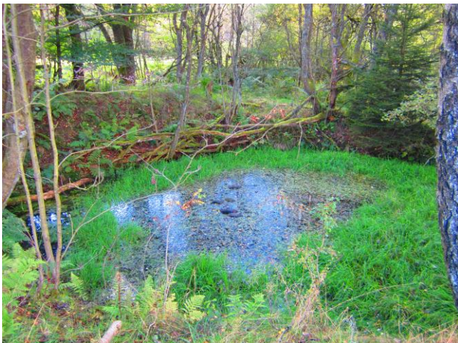
Bombentrichter neben der Eisenbahnstrecke, aufgenommen im September 2014.