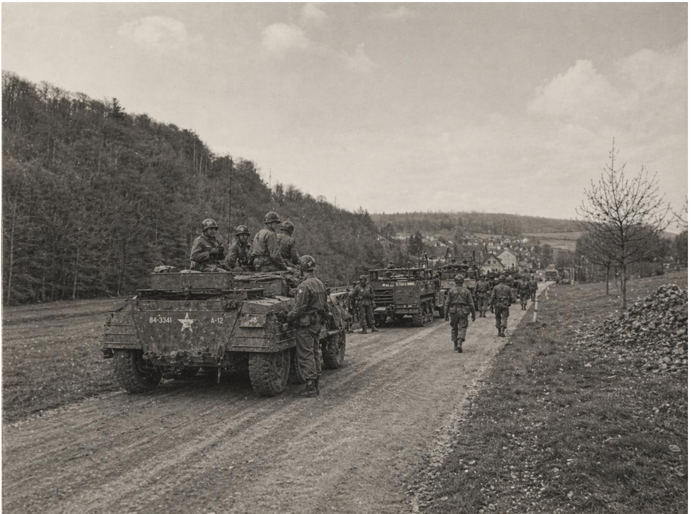
So könnten es am 28. März 1945 ausgesehen haben, als die amerikanischen Soldaten ins Dorf einmarschierten. (KI-generiert, ChatGPT)

War das Benehmen der Kampftruppen durchweg anständig, so ist es doch auch hier zu einzelnen Plünderungen von Geld- und Wertsachen gekommen. Die Angst und den ausgestandenen Schrecken während der Nacht vom 28. zum 29. März wird mancher Einwohner von Emmerzhausen sein Lebtage nicht vergessen.