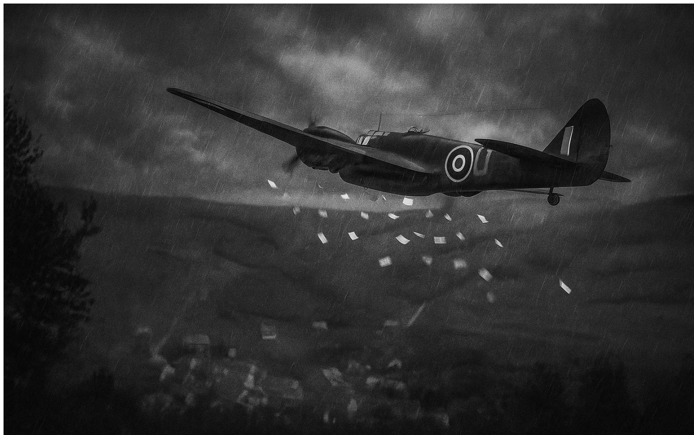
In der Nacht vom 25. auf den 26. September 1939 werfen englische Flugzeuge Flugblätter über Emmerzhausen ab. (KI-generiert, ChatGPT)

Bei einem Luftangriff mit Phosphorbomben wurde ein Hühnerstall im Bereich der Straße „Auf dem Hof“ getroffen. Es waren einige tote Hühner zu beklagen. Der Stall wurde völlig zerstört. An den umliegenden Häusern klebte durch die Explosion Phosphor, welches von den Häusern entfernt werden musste, da es sich bei Sonneneinstrahlung entzündete.