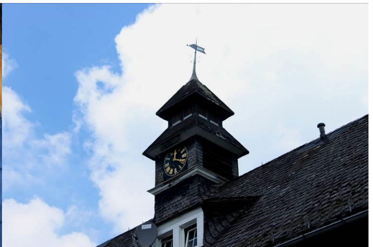
Links: Heinrich Krah beim wöchentlichen Aufziehen der Turmuhr (Foto aus dem Dezember 2002). Rechts: Die "goldenen" Zeiger der Turmuhr zeigen den Emmerzhäusern seit 1909 die richtige Uhrzeit.