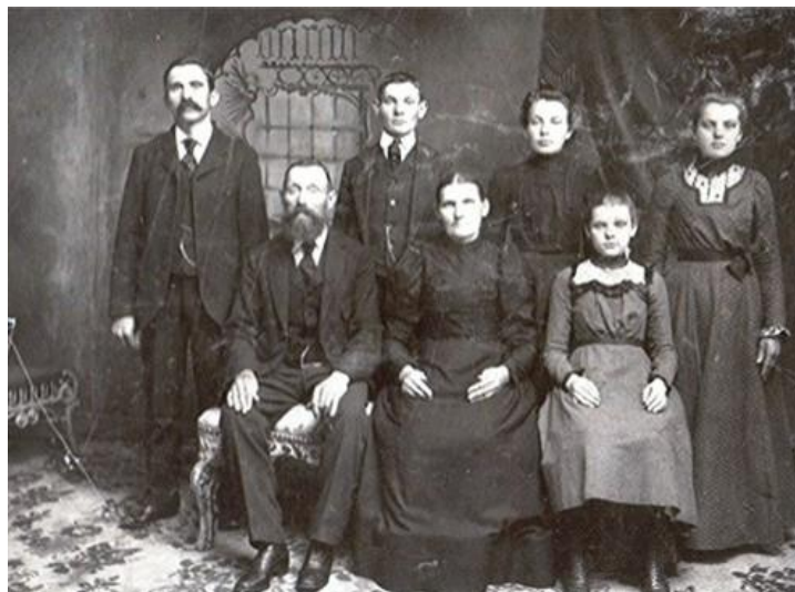
Foto der Familie Kober aus dem Jahre 1881.